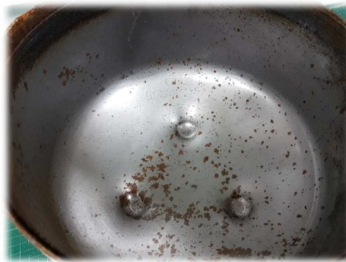
Obr. 2: Spodní část kanystru - uloženo několik měsíců na povětrnosti, na povrchu je již patrná koroze