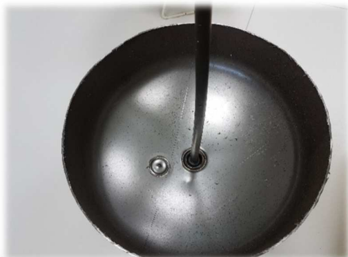
Obr. 1: Vrchní část kanystru s trubicí od ventilu a s proraženým diskem

Systém vyprazdňování zaručuje, že při správném použití v kanystru nezůstává po spotřebování náplně prakticky žádné lepidlo.